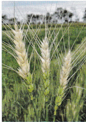
চিত্র-১: (বাম) ব্লাস্ট রোগে আক্রান্ত শীষ এবং (ডান) আক্রান্ত স্থানে কালচে ধূসর দাগ