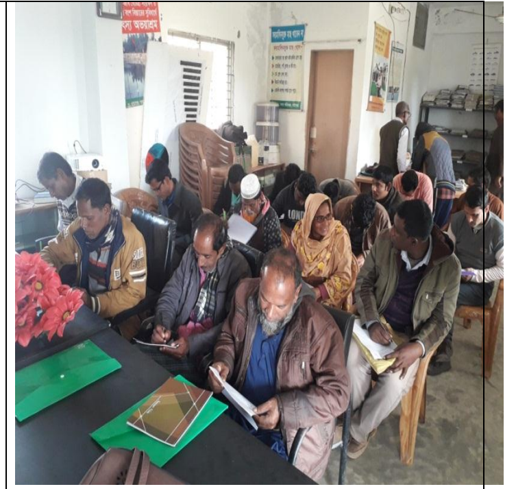
২য় দিন: চিত্র:০৭ এবং চিত্র ০৮ এ আর ডি এফএফদের মাঝে ২ দিনের প্রশিক্ষণের উপর মৎস্য চাষ বিষয়ক পরীক্ষার প্রশ্ন পত্র প্রদান করছেন ক্ষেত্র সহকারী, ফুলছড়ি, গাইবান্ধা।

বাস্তবায়নে: উপজেলা মৎস্য কর্মকর্তা, ফুলছড়ি, গাইবান্ধা।