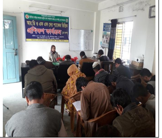
২য় দিন: চিত্র:০৯ এবং চিত্র ১০ এ আর ডি এফএফদের মাঝে ২ দিনের প্রশিক্ষণের উপর মৎস্য চাষ বিষয়ক পরীক্ষা দিচ্ছেন এবং পরীক্ষা পরিদর্শন করছেন উপজেলা মৎস্য কর্মকর্তা, ফুলছড়ি, গাইবান্ধা।