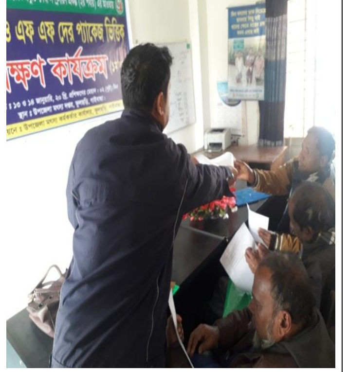
২য় দিন: চিত্র:০৫ এবং চিত্র ০৬ এ আর ডি এফএফদের মাঝে ২ দিনের প্রশিক্ষণের উপর মৎস্য চাষ বিষয়ক পরীক্ষার প্রশ্ন পত্র প্রদান করছেন ক্ষেত্র সহকারী, ফুলছড়ি, গাইবান্ধা।