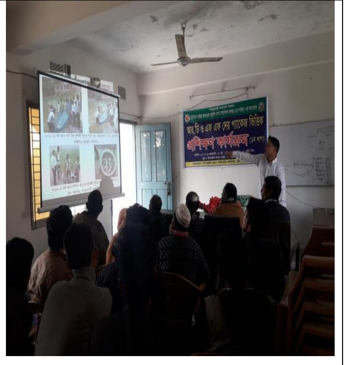
২য় দিন: চিত্র:০৩ এবং চিত্র ০৪ এ আর ডি এফএফদের মাঝে প্রশিক্ষণে ক্লাশ নিচ্ছেন, ক্ষেত্র সহকারী, উপজেলা মৎস্য কর্মকর্তা, ফুলছড়ি, গাইবান্ধা।

বাস্তবায়নে: উপজেলা মৎস্য কর্মকর্তা, ফুলছড়ি, গাইবান্ধা।