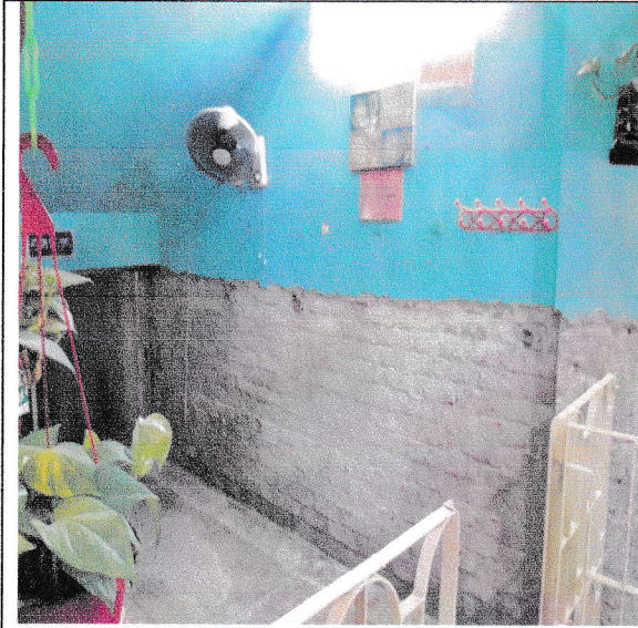
চিত্র: নামায ঘরের আগের অবস্থা

[১.১.১] একটি উদ্ভাবনী খারণা/ সেবা সহজিকরণ/ ডিজিটাইজেশন বাস্তবায়ন