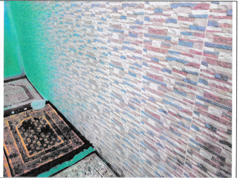
চিত্র: নামায ঘরের বর্তমান অবস্থা