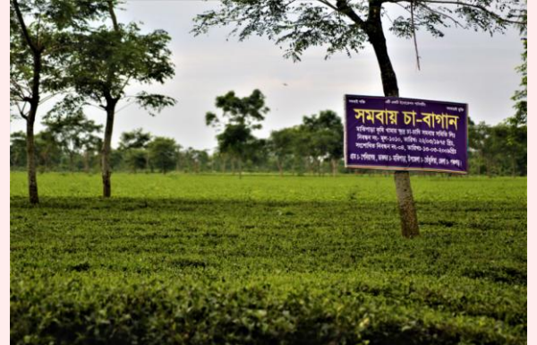
সমিতির সমবায় চা-বাগান