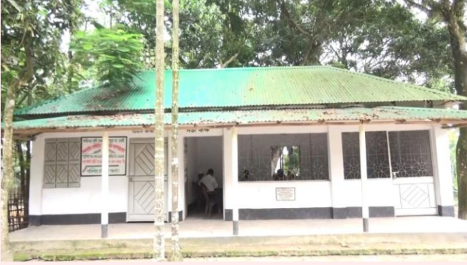
সমিতির অফিস ঘর

মাঝিপাড়া কৃষি খামার ক্ষুদ্র চা-চাষি সমবায় সমিতি লিঃ এর কার্যক্রমের ছবি