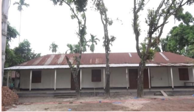
সমিতির অর্থায়নে মাদ্রাসা