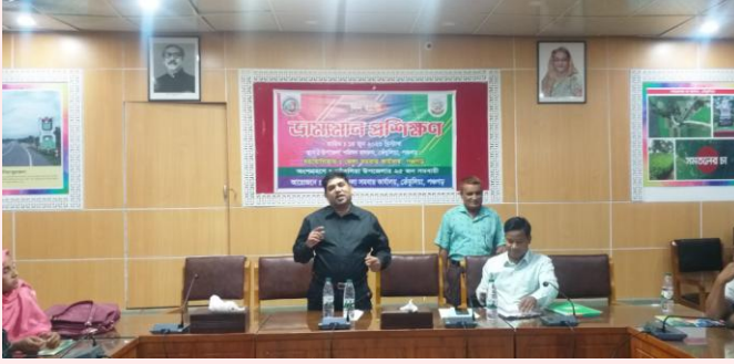
জেলা সমবায় অফিসার, পঞ্চগড় মহোদয় কর্তৃক প্রশিক্ষণ