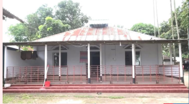
সমিতির অর্থায়নে মসজিদ