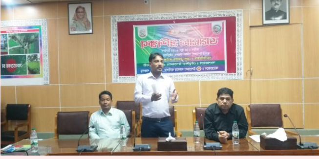
উপজেলা কৃষি কর্মকর্তা কর্তৃক কৃষি বিষয়ে প্রশিক্ষণ