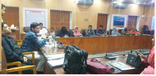
উপজেলা নির্বাহী অফিসার কর্তৃক প্রশিক্ষণ