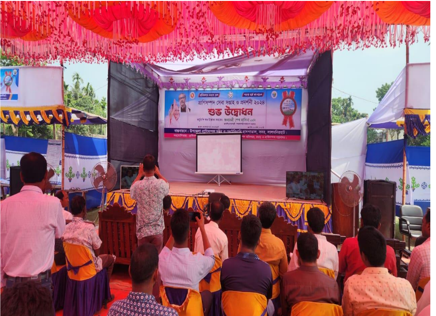
মাননীয় প্রধানমন্ত্রী কর্তৃক প্রাণিসম্পদ সেবা সঙ্গঠ ও প্রদর্শনী-২০২৪ এর উদ্বোধনী অনুষ্ঠান বিটিভি এর মাধ্যমে প্রদর্শন।